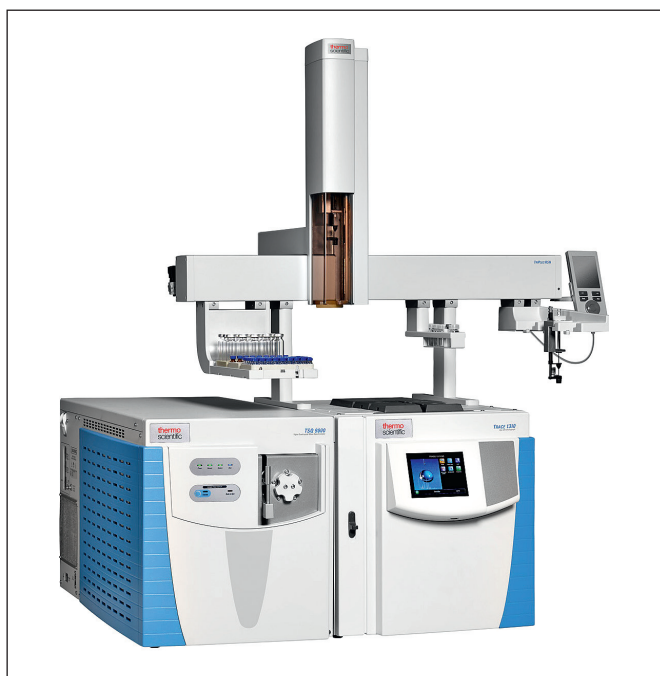
Thermo Scientific TSQ 9000

Скорость сканирования: 20000 а.е.м./с, до 800 SRM переходов в секунду.